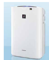
イオン発生機能付加湿空気清浄機