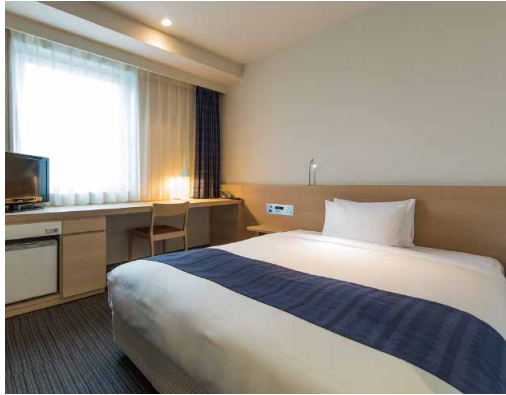
Standard Double Room (スタンダードダブル) || 16㎡ 105室

お客さまにより快適により満足してお過ごしいただけるよう、 内装や家具・寝具にこだわり、設備やサービスも充実させました。 宮崎の海をイメージしたブルーがアクセントカラーの光あふれる明るい客室でごゆっくりおくつろぎください。