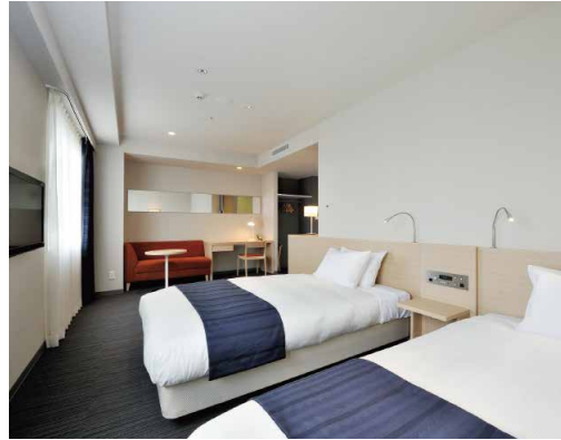
Deluxe Twin Room (デラックスツイン) || 32㎡ 29室

140cm幅のゆとりのあるベッドを配し、機能的でありながらリラックスできるナチュラルで清潔感のあるカラーリングの客室です。