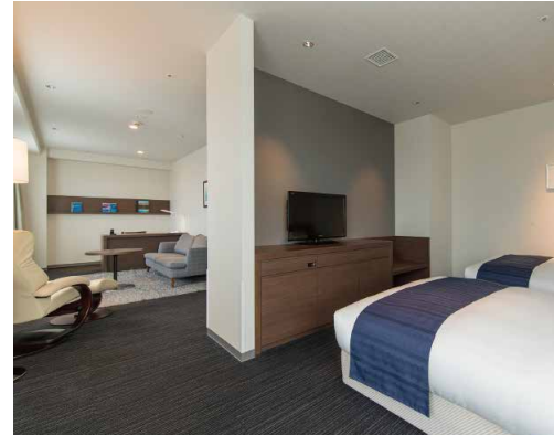
Premium Twin Room (プレミアムツイン) || 50㎡ 1室

海や山並みまで見晴らせる広い窓に面した客室。3名までのご利用(エキストラベッド対応)も可能。グループ旅行にも最適です。