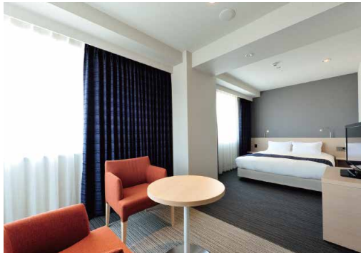
Deluxe Double Room (デラックスダブル) || 32㎡ 5室

ホテルからの眺望 目の前に広がる市街地、かなたに見える雄大な山並みは、癒しだけでなくパワーも与えてくれます。