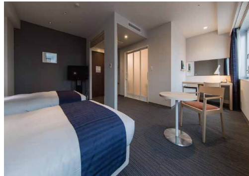
Universal Twin Room (ユニバーサルツイン) || 32㎡

ゆとりのある客室に160cm幅のベッドを配し、お一人でもお二人でもくつろげる、心地よい空間をお約束します。